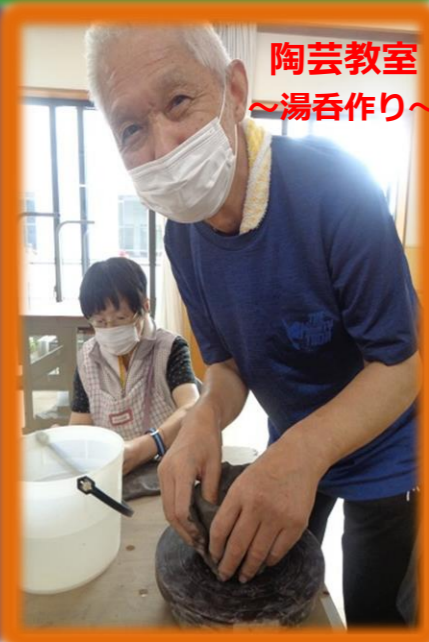
陶芸教室 ～湯呑作り～