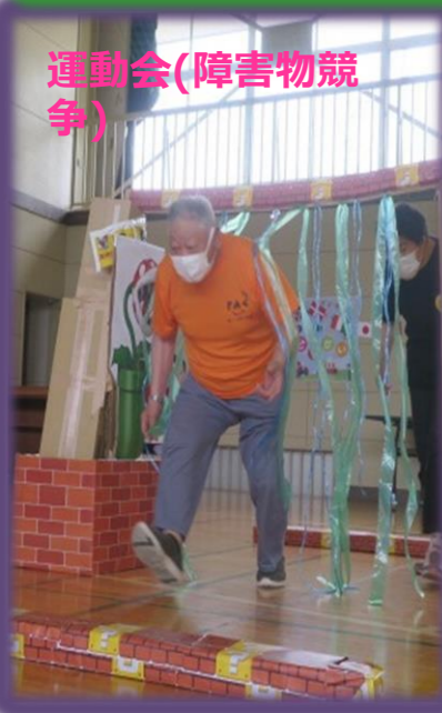
運動会(障害物競争)