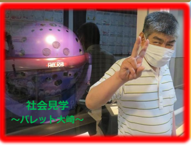
社会見学 ～パレット大崎～