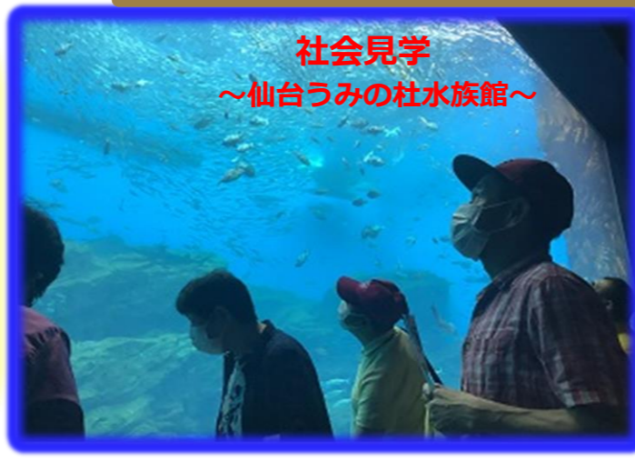
社会見学 ～仙台うみの杜水族館～