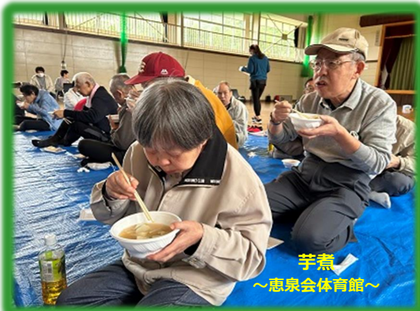
芋煮 ～恵泉会体育館～