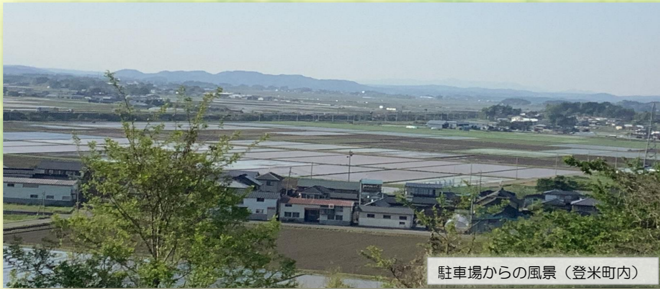
駐車場からの風景（登米町内）

東は北上川に望み、西は栗駒山を仰ぎ、明治時代の建物を今なお残す登米町に位置する光風園は、自然と歴史が織りなす人々と風土の中で、ゆとりとおいある生活を提供いたします。