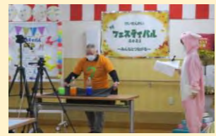
▲オンラインフェスティバル

令和3年度も新型コロナウイルス感染症の影響により、各施設・事業所では、地域貢献事業であるオレンジカフェ（認知症カフェ）や各種計画の中止を余儀なくされましたが、オンラインで各拠点間をつないでのフェスティバルを実施するなど、工夫と検討を重ねながら、利用者の皆様に喜んで頂けるような行事を企画実施いたしました。 施設整備では、特別養護老人ホームのナー スコールシステムを更新、タブレットやスマートフォンと連携したシステムにより見守りを強化するなど、サービスの向上と職員の業務負担軽減を図りました。 また、登米市中田町の旧こじか園を「多機能サポートセンターこじか」と改めリニューアルし、従来の児童発達支援センターとしての事業はそのままに、新たに「生活介護事業所レポス」を開設し、18歳以上の方を対象に日中活動の場を提供いたしました。