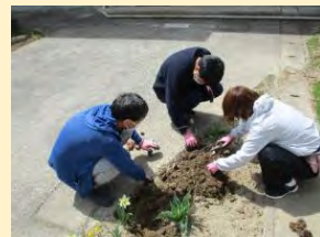
▲レポスの日中活動（花の植栽）