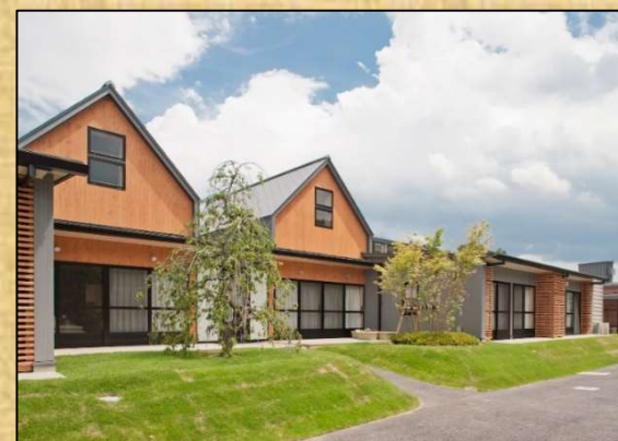
▲現在の若草園(平成23年改築移転)

恵泉会はこれからも時代のニーズに合わせ、地域の皆様とともに未来に向けた地域福祉を創造し、心に届く福祉サービスを提供してまいります。